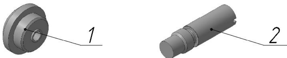
Рисунок 16- Клапан предохранительный Н478.03.04.000